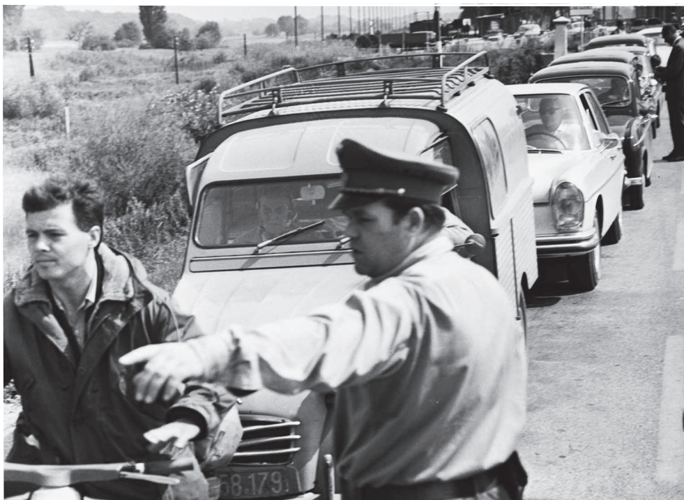
Československo opúšťalo množstvo ľudí.