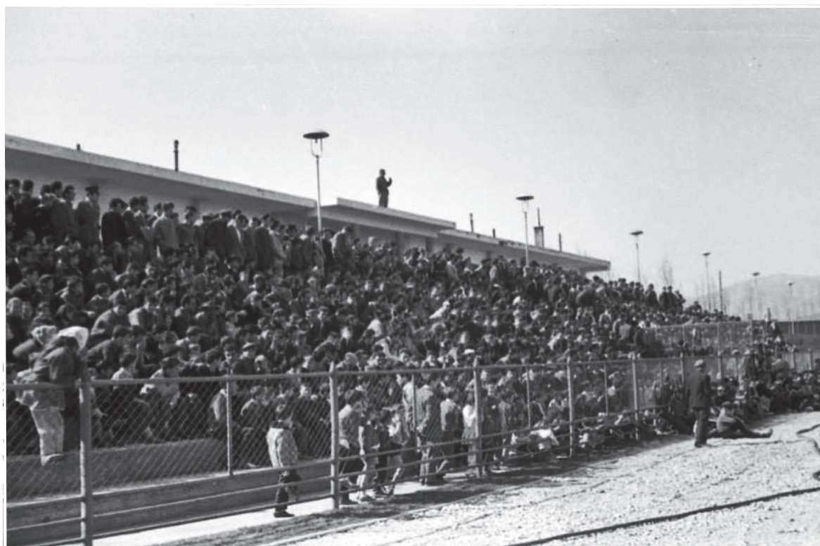
Tribúna na štadióne RFK Bor. Oslnivo nepôsobila.

Hráči RFK sľubovali v domácom prostredí revanš. Vo svojom zápase v rámci ligy remizovali v Mostare so silným Veležom 0:0 a držali sa na 11. mieste ligovej tabuľky.