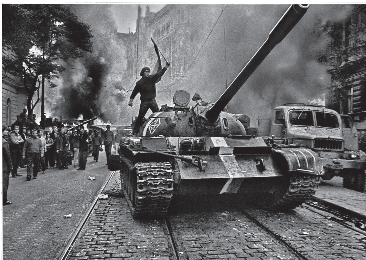
Obrázky z československých miest boli podobné.