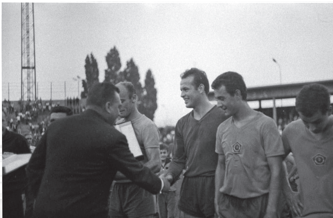
Tým Slovana prijíma gratulácie po víťazstve v Československom pohári.