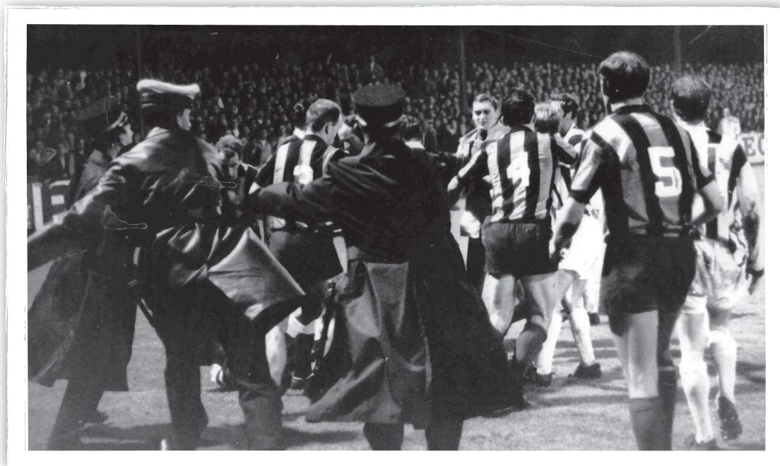
V zápasoch medzi Bruggami a West Bromwichom sa iskrilo.

Výsledky slovenských tímov boli potešujúce. V PVP postúpil Slovan, v EPM zvládla po Adamcovom hetriku Trnava odvetu so Steauou Bukurešť (4:0). Pokiaľ išlo o zápasy 1. kola PVP, odohrali sa bez prekvapení. Jedno síce bolo na dosah, ale favorit si svoju pozíciu ustrážil. Albánsky Partizani Tirana totiž vypadol s talianskym AC Turín až po nečakane tuhom boji. Doma prekvapil slušnou technikou a dobrým pohybom a zvíťazil 1:0. V Turíne prehral 1:3. „Postúpili sme, a to je najdôležitejšie,“ povedal tréner AC Turín Edmondo Fabbri.