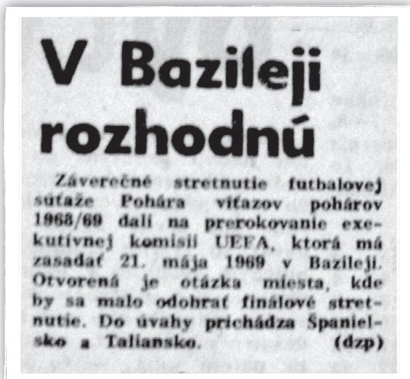
Otázka chybného prekladu? Vydanie Športu z 5. novembra 1968 hovorí o tom, že 21. mája 1969 sa v Bazileji rozhodne o tom, kde sa bude hrať finále PVP. Ibaže finále PVP sa hralo 21. mája 1969 práve v Bazileji...