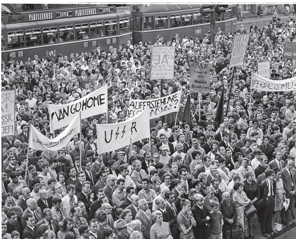
Na celom svete sa uskutočňovali manifestácie na podporu Československa. Táto bola 22. augusta 1968 v Bazileji. Teda v meste, ktoré o deväť mesiacov slovanistom prirástlo k srdcu.