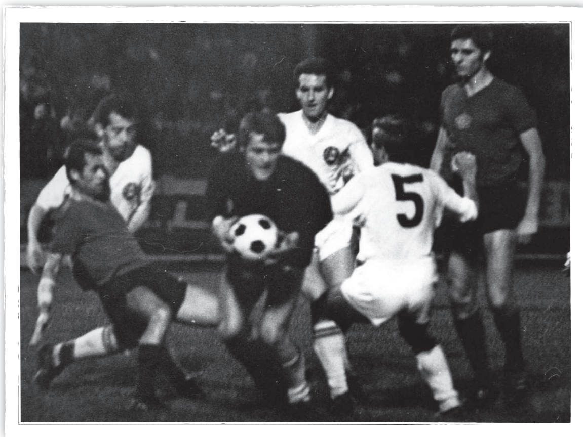
Situácia zo zápasu Slovan – Wiener Sport – Club (3:1).