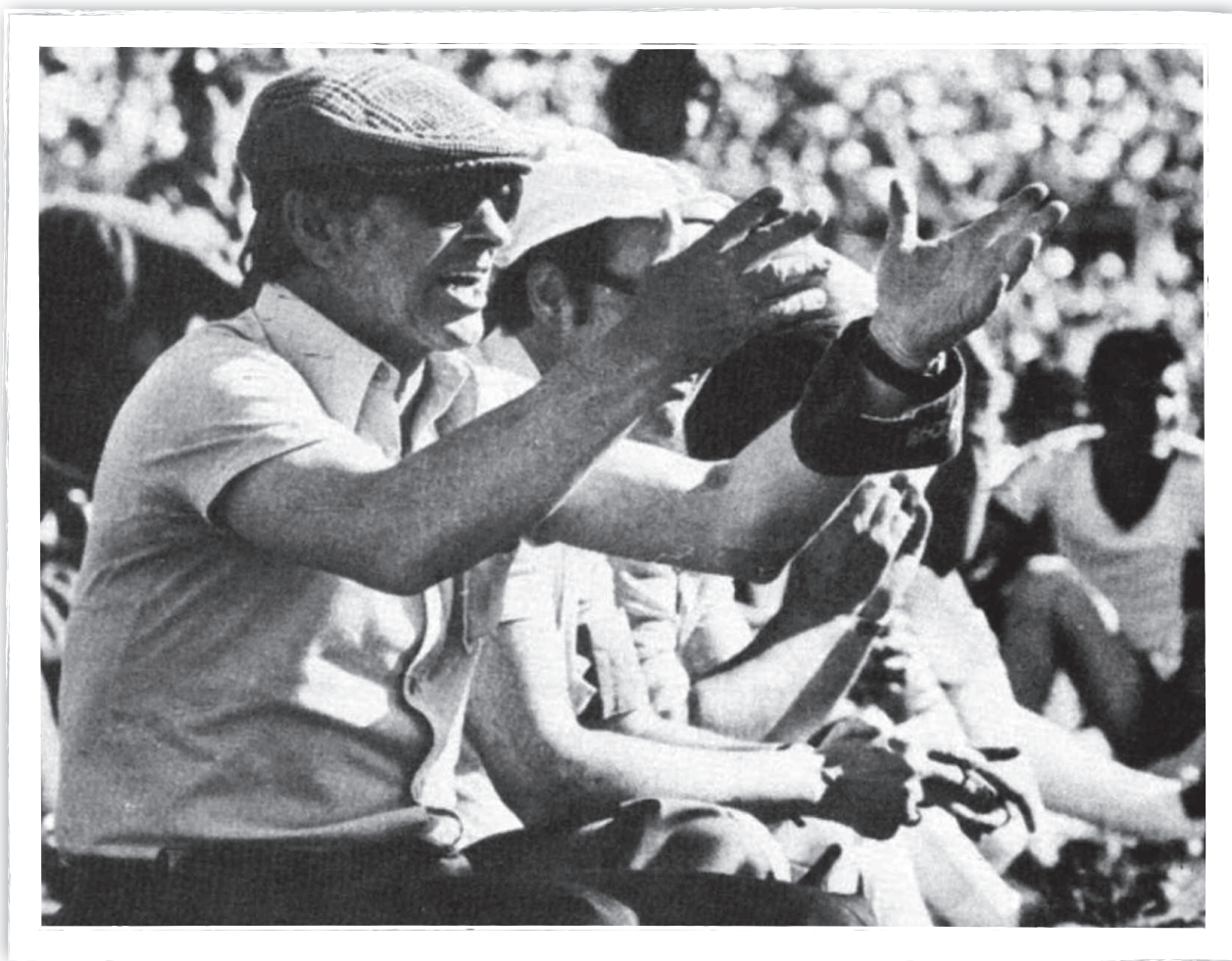
Tréner José Pedroto asi zápasy v Československu neobluboval. Zažil dva so sumárnym skóre 0:9.

Portugalska. V kvalifikácii na ME 1976 sa s ňou stretol v skupine s reprezentáciou ČSSR. Návšteva Československa pre Pedrota opäť nedopadla dobre. V Prahe prehralo Portugalsko s ČSSR ešte horšie ako v Bratislave – po výsledku 0:5.