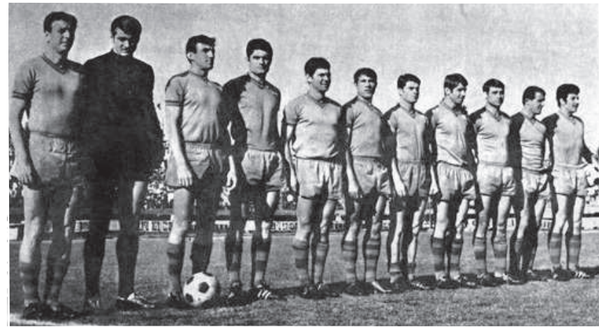
Steaua Bukurešť – súper trnavského Spartaka v 1. kole EPM 1968/ 1969.