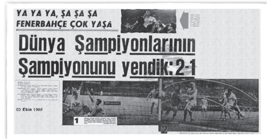
Obrovské prekvapenie 1. kola ospevovali turecké noviny, v tomto prípade denník Hürriyet.

Veľkým prekvapením 1. kola bolo vyradenie práve anglického majstra Manchesteru City tureckým Fenerbahce Istanbul. Kouč Citizens Malcolm Allison pritom už v máji 1968, hneď po zisku titulu, vyhlasoval, že jeho tím „ ukáže tým desivým zbabelcom z Európy, ako sa hrá futbal. “ Turecký klubový futbal vtedy na mape európskeho futbalu naplnil skôr pozíciu komparzistov, očakávalo sa akurát to, čo v Manchestri dostanú Istan-